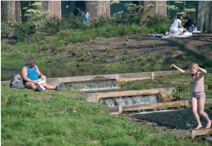
WESTERPARK | 22.04.07 | 16.42 UUR