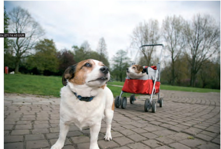
BEATRIXPARK | 13.04.07 | 14.40 UUR