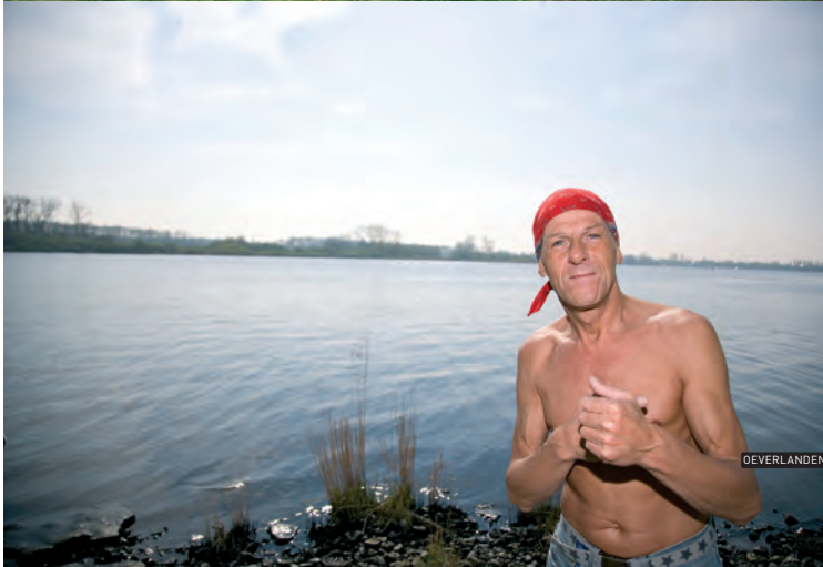
DEVERLANDEN | 13.04.07 | 15.55 UUR