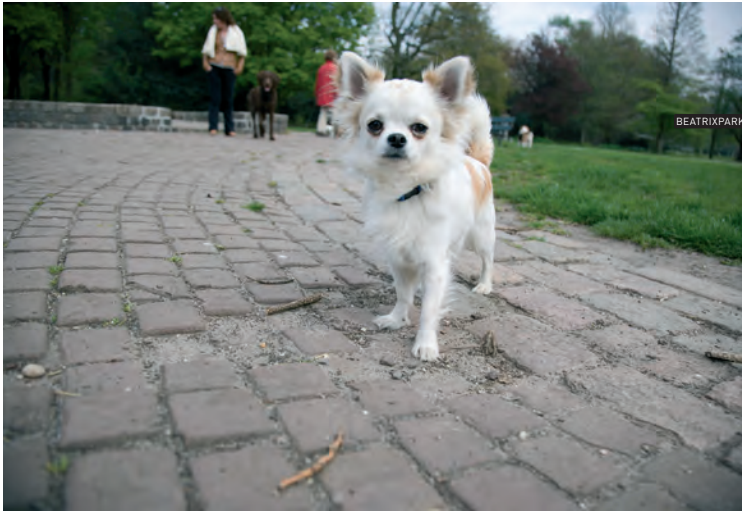
BEATRIXPARK | 13.04.07 | 14.26 UUR