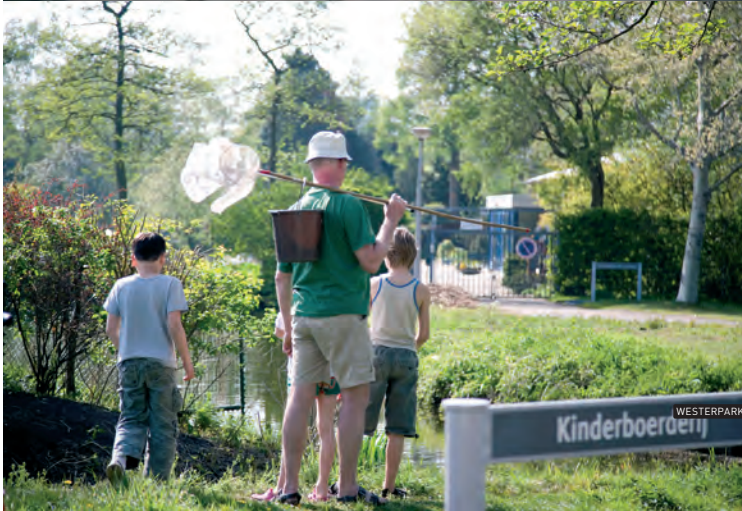
WESTERPARK | 22.04.07 | 16.35 UUR