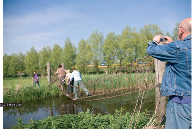
WESTERPARK | 22.04.07 | 16.08 UUR